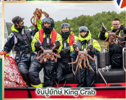
จับปูยักษ์ King Crab