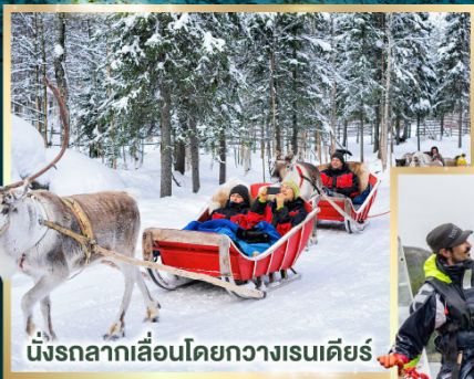
นั่งรถลากเลื่อนโดยกวางเรนเดียร์