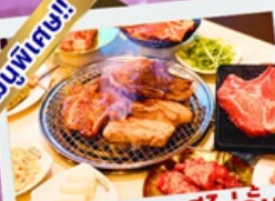
ปิ้งย่างเกาหลีไม่อื่น