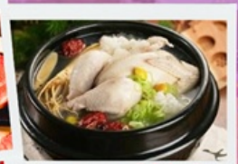
อาหารวังหลวงไก่ตุ๋นโสม