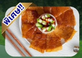
สุกี้หม่าล่า