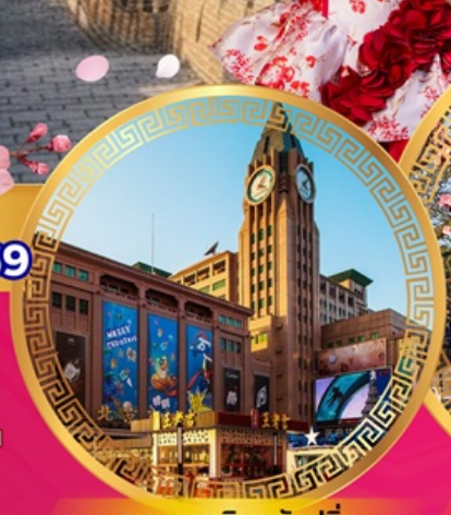
ถนนคนเดินหวังฝูจิ่ง

เที่ยวย่านการค้าดังกลางกรุงปักกิ่ง ถนนคนเดินหวังฝูจิ่ง จัตุรัสเทียนอันเหมิน พระราชวังกุ๊กกิง หอฟ้าเทียนถาน ช้อปปิ้งย่านซานหลี่ถุน พระราชวังฤดูร้อนอวี่เหอหยวน กำแพงเมืองจีนด่านอวิหยกกววน ชมซากุระบาน สักการะวัดลามะ