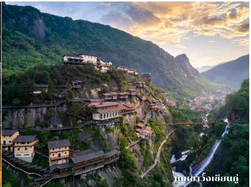
หุบเขาฉางเจียงหนู่

ที่พัก Shangrao jialaite Hotel 4* หรือเทียบเท่า