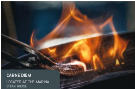
CARNE DIEM LOCATED AT THE MARINA STEAK HOUSE