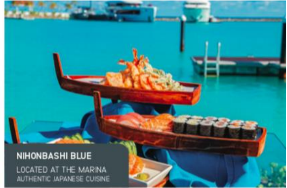
NIHONBASHI BLUE LOCATED AT THE MARINA AUTHENTIC JAPANESE CUISINE