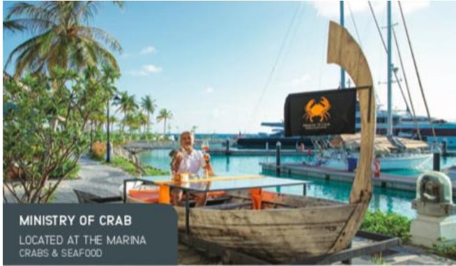
MINISTRY OF CRAB LOCATED AT THE MARINA CRABS & SEAFOOD