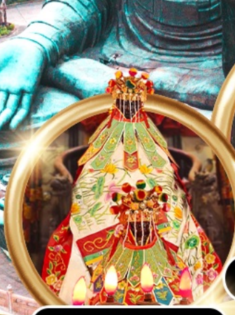
ยืมเงินเจ้าแม่กวนอิมสองห้า