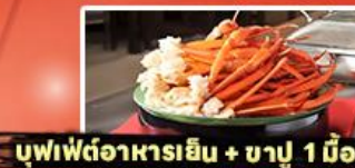
บุฟเฟ่ต์อาหารเย็น + ชาบู 1 มื้อ

รหัสทัวร์ RJ-XJ134 เดินทาง 5D 3N ก.ย. - ต.ค. 2569