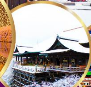
วัด คิโยมิสึ