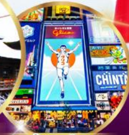
ช้อปปิ้ง ซินโซบาชิ