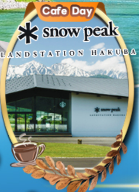
Snow Peak Land Hakuba