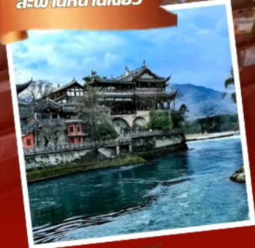
พิพิธภัณฑ์หออูรักซ์แพนด้า