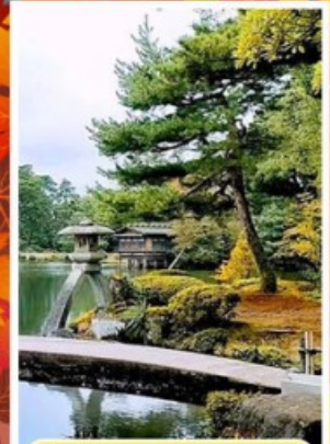
สวนเคนโรคุเอ็น