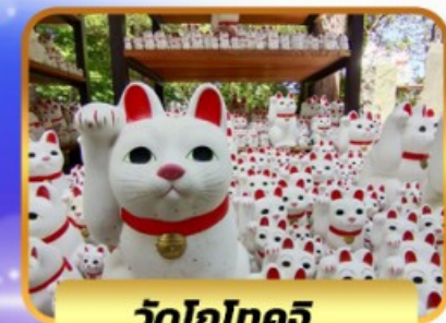
วัดโทโทจิว