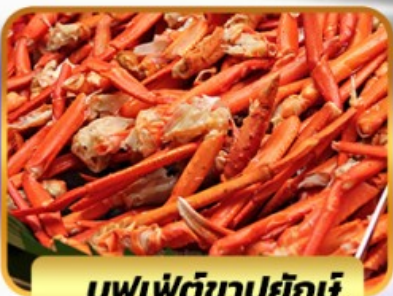
บุฟเฟ่ต์ขาปูยักษ์