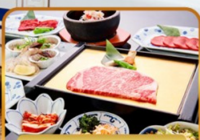
บิ๊นย่างร้านดัง ROKKASEN