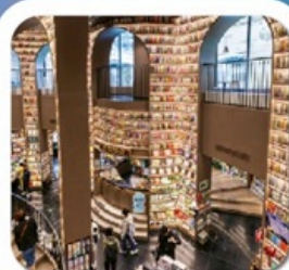
"ห้างสรรพสินค้าจงซูเก๋อ"