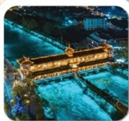
"สะพานหนานเฉียว"