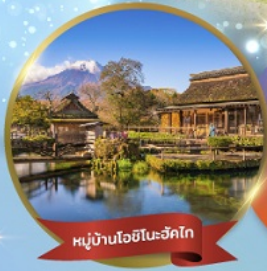
หมู่บ้านโอชิโนะซึกิโก