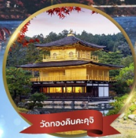
วัดทองคินคะคุจิ

"เข้าโอซาก้า ออกโตเกียว เที่ยวสบายไม่ย้อนทาง"