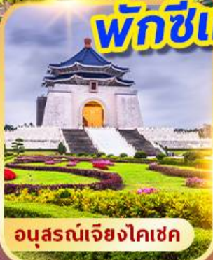
อนุสรณ์เจียงไคเช็ค