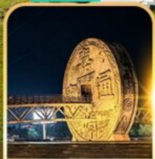
จัตุรัสเหรียญโบราณ