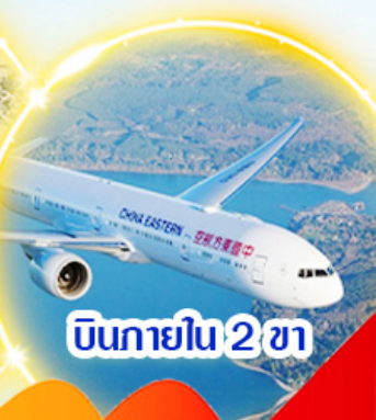
บินภายใน 2 ชม