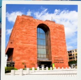
Nagasaki Atomic Bomb Museum