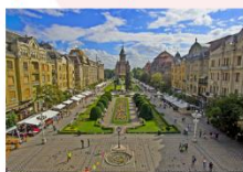
เมืองซีบีอู