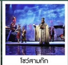
โชว์สามก๊ก