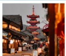
หมู่บ้านเหนียนฮวาวาน