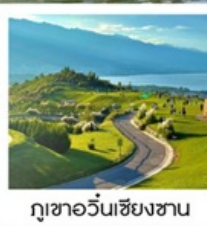
กุซาอวั้นเซียงซาน