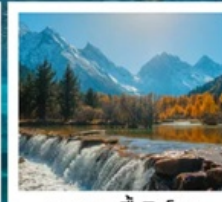
อุทยานπίงโงว