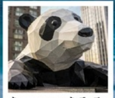
ห้าง IFS แพนด้าป็นตึก

จัดทริปหย่างเก๋ย่นวู / รูปปั้นหมีแพนด้าเซลฟี / เมืองโบราณก้วนเซี่ยน คำธารสีฟ้า / อุทยานภูเขาสี่ดรุณี / อุทยานชวงเฉียวโกว (รวมรถอุทยาน) อุทยานπίงโงว (รวมรถอุทยาน + รถแบตเตอร์) / อุทยานจิวจ้ายโกว (รวมรถเหมา) ถนนคนเดินซุนชู่ / ห้าง IFS แพนด้าป็นตึก / ถนนคนเดินไท่กู่หลี่ ถนนคนเดินชอยกว้างแคบ (POP MART)