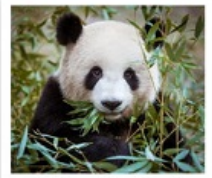
ศูนย์หมีแพนด้าตูเจียงเยียน