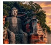
หลวงพ่อดเล่อซาน