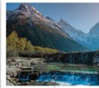
อุทยานป่าผิงโกว