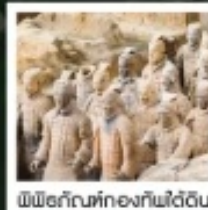
พิพิธภัณฑ์ทองคำฟัดี้ฉิน

ทัวร์คุณภาพ ไม่หลงร้านช้อปปิ้ง ไม่ขายของฝืน