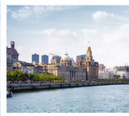
หาดว่อกาน