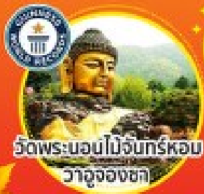
วัดพระบอมนมโง่นทร์หอม วาจุงองชกา