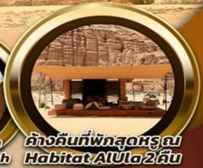
ค้ำคืนที่พักสุดหรู Habitat AlUla 2 คืน