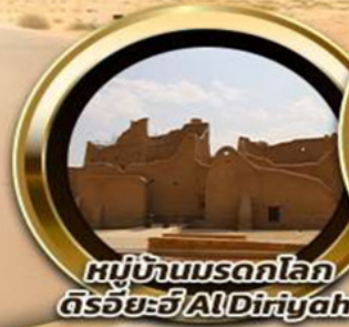
หมู่บ้านมรดกโลก ดิริยะฮ์ AlDiriyah