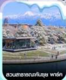
สวนสาธารณะคันซุย พาร์ค