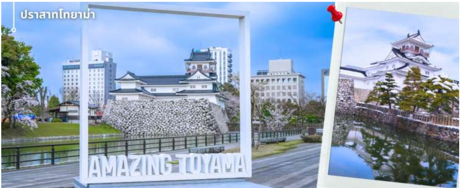
ปราสาทโทยาม่า

หลังจากรับประทานอาหารเที่ยง นำท่านเปลี่ยนบรรยากาศเข้าสู่ เมืองโทยาม่า เป็นเมืองที่มีเสน่ห์จากการผสมผสานระหว่างธรรมชาติและวัฒนธรรมได้อย่างลงตัว โดยมีฉากหลังเป็นเทือกเขาแอลป์ญี่ปุ่นอันยิ่งใหญ่ และมีชื่อเสียงด้านอาหารทะเลสดจากอ่าวโทยาม่า ซึ่งได้รับการยกย่องว่าเป็นหนึ่งในอ่าวที่อุดมสมบูรณ์ของญี่ปุ่น บรรยากาศภายในเมืองมีความสะอาด เป็นระเบียบ และเงียบสงบ สะท้อนวิถีชีวิตแบบญี่ปุ่นท้องถิ่นได้อย่างชัดเจน ภายในเมืองยังมีเส้นทางรถรางที่เป็นเอกลักษณ์ วิ่งผ่านย่านสำคัญต่าง ๆ เพิ่มเสน่ห์ให้กับทัศนียภาพของเมืองได้อย่างลงตัว นำท่านเดินทางไปที่ปราสาทโทยามะ Toyama Castle (ด้านนอก) แลนด์มาร์คทางประวัติศาสตร์อันเป็นสัญลักษณ์ของเมือง โดยนำท่านชมความสวยงามทางสถาปัตยกรรม ซึ่งโดดเด่นด้วยกำแพงหินสีขาวสะอาดตัดกับสีเขียวของสวนสวยรอบตัวปราสาท ท่านจะได้ชื่นชมความวิจิตรของป้อมปราการที่สะท้อนเงาบนผืนน้ำในคูเมืองอย่างงดงาม พร้อมเดินเล่นถ่ายภาพปราสาทจากสวนสาธารณะที่ล้อมรอบปราสาทโทยาม่า ภายในพื้นที่มีทั้งคูน้ํา แนวต้นไม้ และพื้นที่สีเขียวที่จัดไว้อย่างเป็นระเบียบ บริเวณสวนสามารถมองเห็นตัวปราสาทสีขาวที่ตั้งโดดเด่นอยู่ท่ามกลางทัศนียภาพโดยรอบได้อย่างสวยงาม ซึ่งในแต่ละฤดูกาลจะมอบบรรยากาศที่แตกต่างกันไป มอบความรู้สึกสงบและอิมเมจไปกับเรื่องราวในอดีตที่ยังคงได้รับการรักษาไว้อย่างสมบูรณ์ท่ามกลางความทันสมัยของเมืองโทยามะ พร้อมทั้งให้ท่านได้ถ่ายรูปกับจุดไฮไลต์ภายในสวน Amazing Toyama จุดที่ท่านจะสามารถมองเห็นปราสาทโทยาม่าได้อย่างสวยงามตระการตา