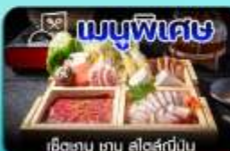
เช็ตซาฮู ซาฮู สไตล์ญี่ปุ่น