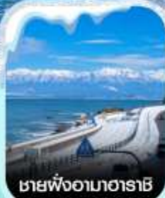
ชายฝั่งอามาฮาราชิ