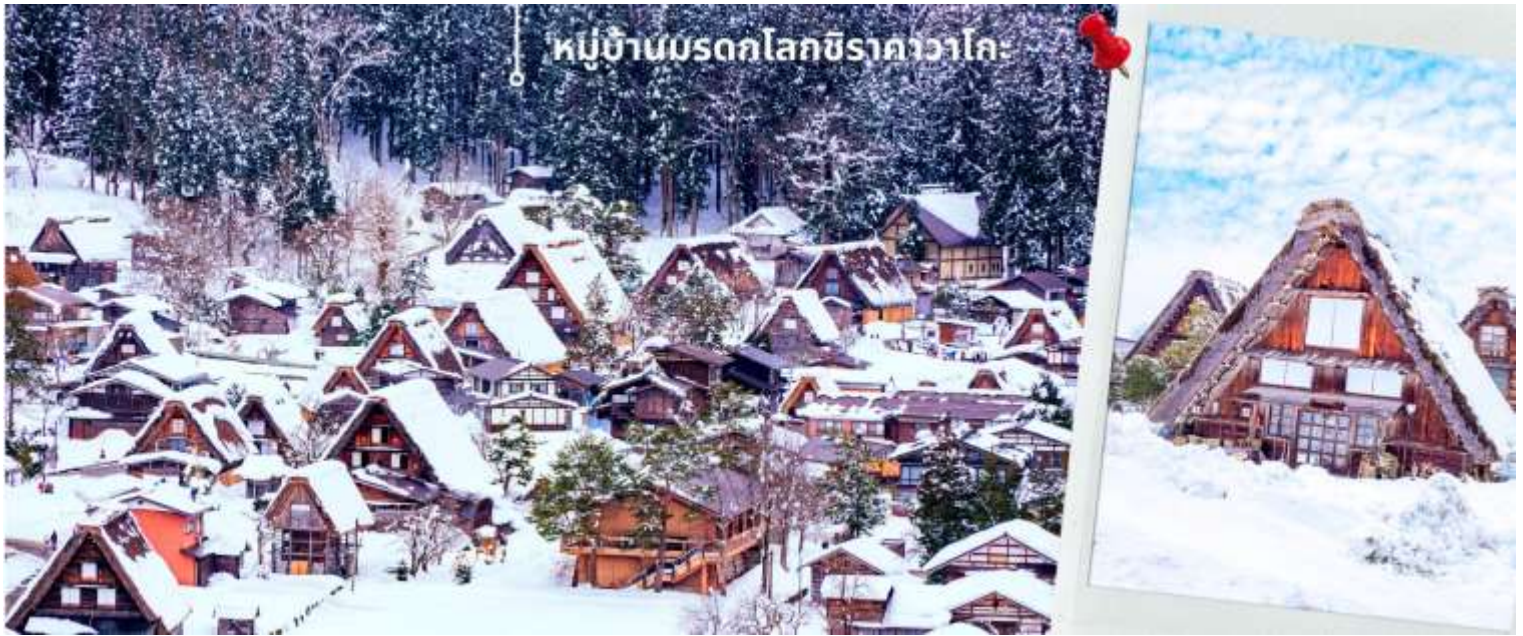
หมู่บ้านบรอกโลกชิราคาวาโกะ