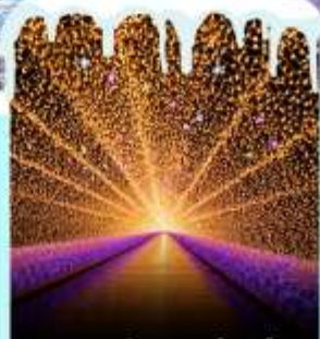
งานประดับไฟนาบานะโนะซาโตะ