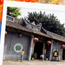
วัดกวนอูเซินเจิ้น