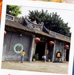
วัดกวนอูเซินเจิ้น