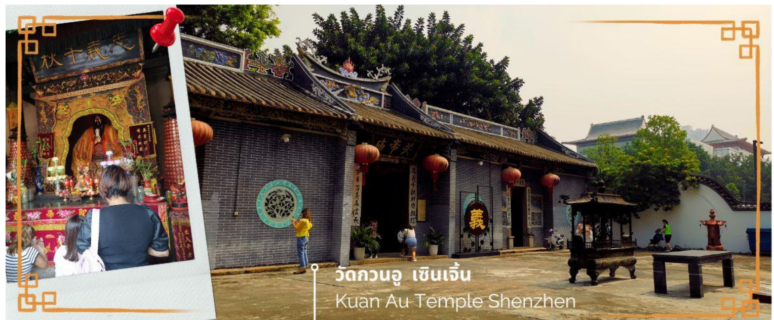
วัดกวนอู เซินเจิ้น Kuan Au Temple Shenzhen

จากนั้นนำท่านเดินทางสู่ วัดกวนอู ไหว้เทพเจ้ากวนอู สัญลักษณ์ของความซื่อสัตย์ ความกตัญญูรู้คุณ ความจงรักภักดี ความกล้าหาญ โชคลาภ และบารมี ท่านเปรียบเสมือนตัวแทนของความเข้มแข็งเด็ดเดี่ยวของอาจไม่ครั้งคร้ามต่อศัตรู ท่านเป็นคนจิตใจมุ่งมั่นคงตั้งขุนเขา มีสติปัญญาเฉลียวฉลาด และไม่เคยประมาทการบูชาขอพรท่านก็หมายถึงขอให้ท่านช่วยอุดช่องว่างไม่ให้เพลิงพลั่วแก่ฝ่ายตรงข้าม และให้เกิดความสมบูรณ์ด้วยคนข้างเคียงที่ซื่อสัตย์ หรือบริวารที่ไว้วางใจได้นั้นเองดังนั้นประชาชนคนจีนจึงนิยมบูชา และกราบไหว้เพื่อความเป็นสิริมงคลต่อตนเอง และครอบครัวในทุกๆ ด้าน