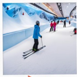
บ้านหิมะ WINDOW OF THE WORLD