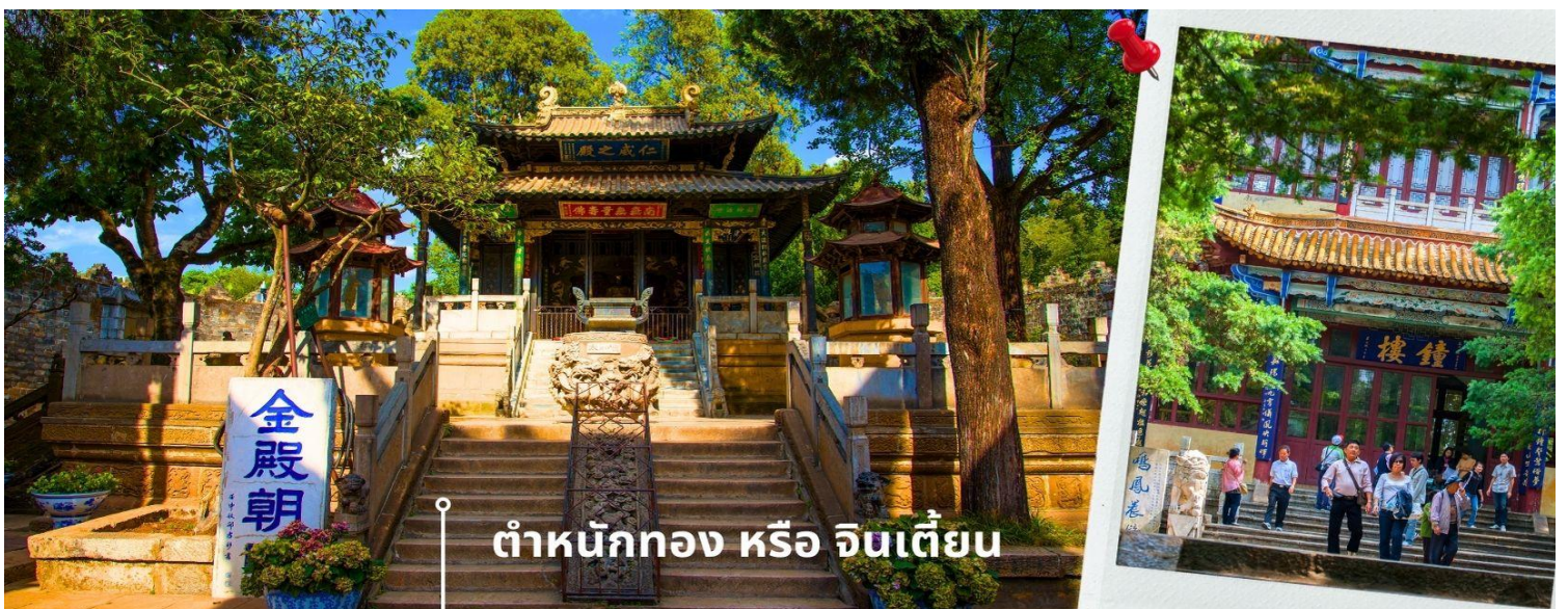
ตำหนักทอง หรือ จินเตี้ยน