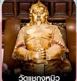
วัดเซ่งก้งหมีว