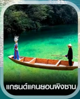
แกรนด์แคนยอนผิงชาน

คอนเฟิร์มออกเดินทาง ทุกพีเรียด 2 ท่านขึ้นไป