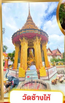
วัดช้างไห้