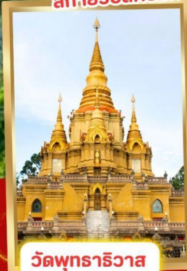
วัดพุทธาริवास