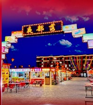
ตลาดกลางคืน ตาลาเดอดี