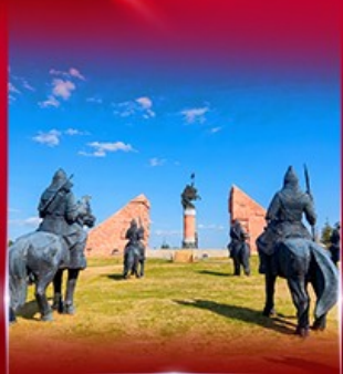
สวนสาธารณะหงกิล่า