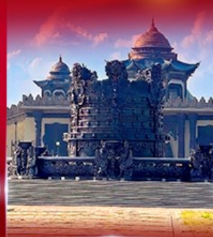
ศูนย์วัฒนธรรม มองโกเลีย หยวนหลิว