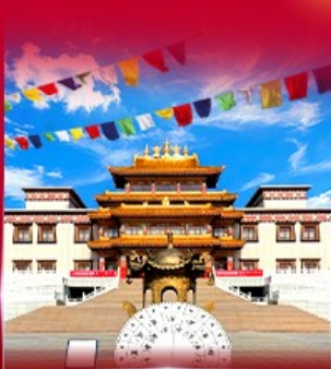
วัดพระโพธิสัตว์ อูลาน