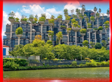
ตึก 1,000 ต้นไม้