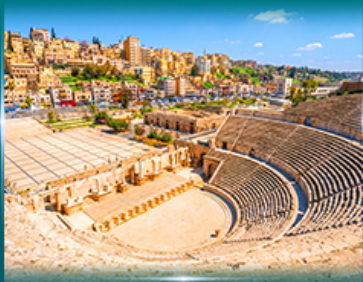
โรงละครโรมัน อัมมาน