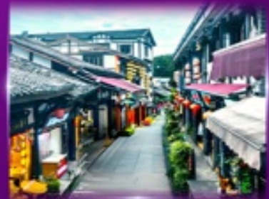
หมู่บ้านโบราณฉิวซื่อ