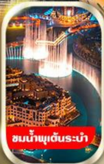
ชมน้ำพุต้นระบำ

นั่งรถ 4WD ชมทะเลทรายอาหรับ พร้อมทานดินเนอร์อาราเบีย