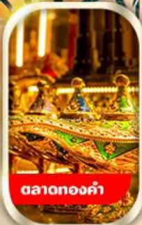
ตลาดทองคำ