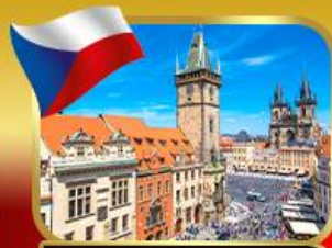
ชมวิวยุทธศาสตร์เมืองปราก