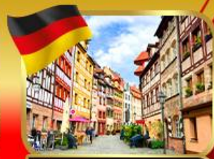
เที่ยวย่านเมืองเก่าบูเรมเบิร์ก