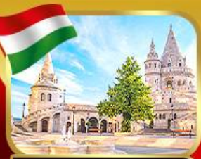
ปิอชชาวประมงเมืองบูดาเปสต์