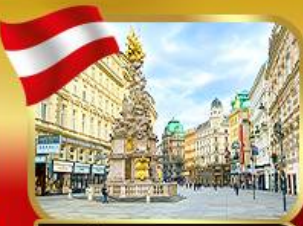
ช้อปปิ้งย่านคาร์ทเนอร์สตรีก