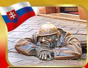
เข็ควินคู่คูมิลเมืองบราติสลาวา