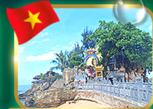
สักการะขอพรศาลเจ้าอึ้งก๊วก