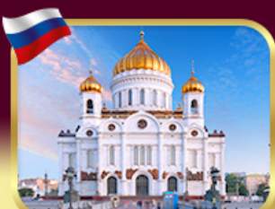
มหาวิหารเซนต์ซาวีร์