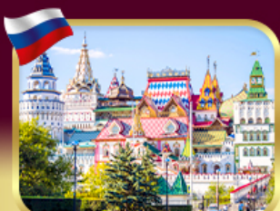
อิสมาลอฟสกีมาร์เก็ต