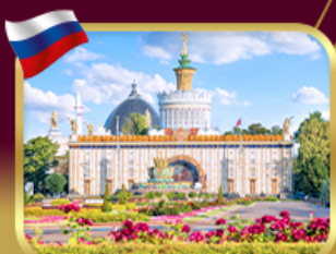
สวนสาธารณะ VDNKH