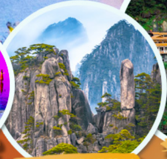
ภูเขาทวงชาน