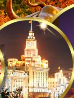
เดอะมันด์