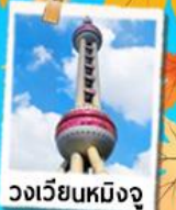
วงเวียนหมิงจู่