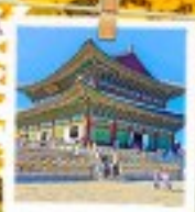
วังเคียงบกทง