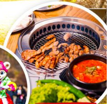
หมูย่างเกาหลี