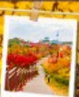
นัมซานพาร์ค