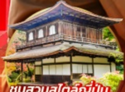
ชมสวนสโตนี่ญี่ปุ่น.. Ginkakuji Temple