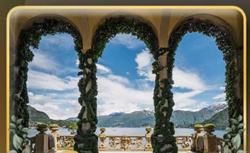
เชคอิน Villa del Balbianello

ที่สุดของธรรมชาติแห่งอิตาลี ทิวเขา ทะเลสาบ ความงามแห่งโดโลไมท์