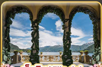
เชคอิน Villa del Balbianello

ที่สุดของธรรมชาติแห่งอิตาลี ทิวเขา ทะเลสาบ ความงามแห่งโดโลไมท์