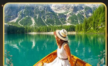
พายเรือทะเลสาบ Braies