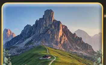
เยือน Passo Giau