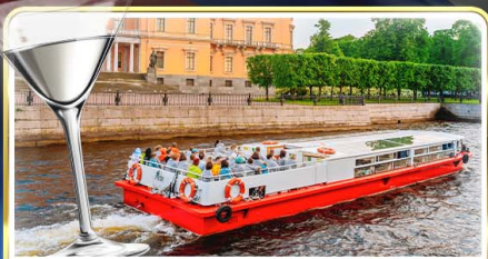
ส่องเรือแม่น้ำแคว พร้อมเสิร์ฟ Vodka Tasting

เดินทาง : 14-21 มิ.ย.69 / 28 มิ.ย.-05 ก.ค.69 / 24-31 ก.ค.69