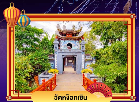
วัดหวังอกเขิน